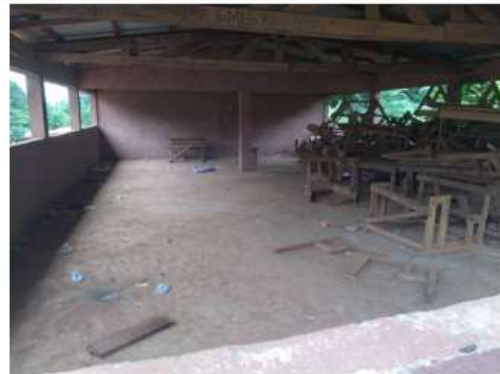
Comedor del Instituto