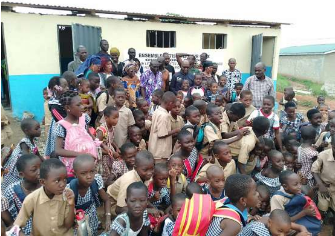
IV-3. APOYO SANITARIO EN COSTA DE MARFIL