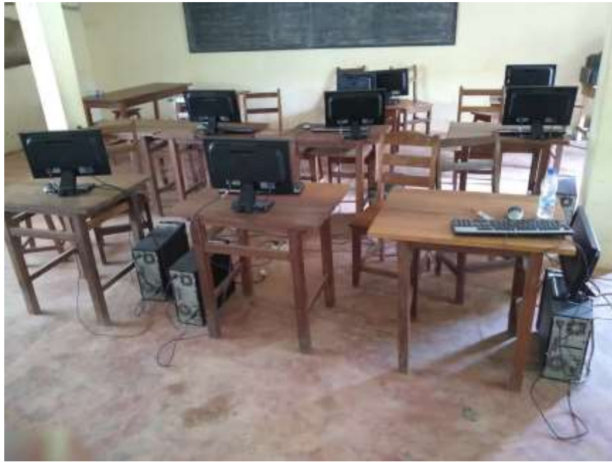
Aula de informàtica.