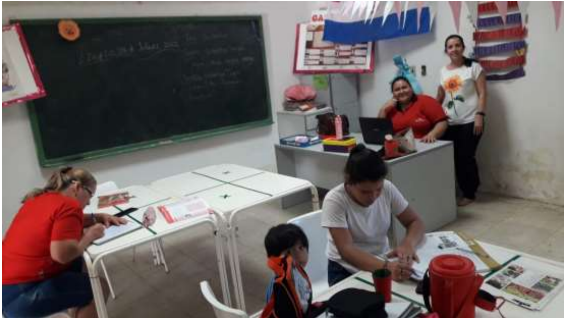
Clases de repaso